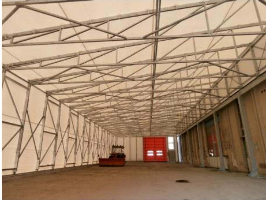
Tunnel mobile su binari (MODENA)