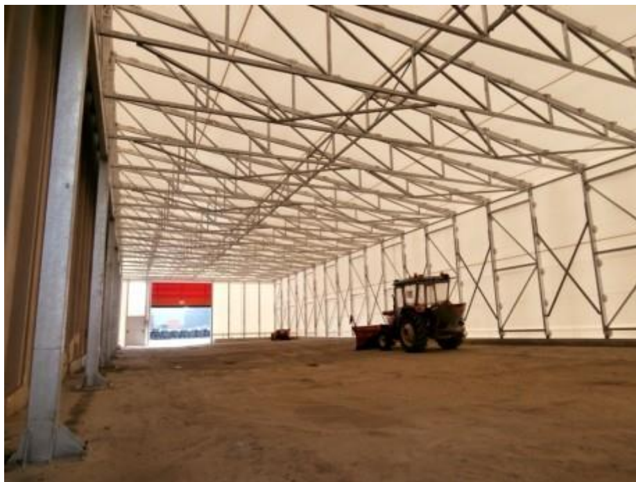
Capannone mobile su binari (MODENA)

Importante società italiana, conosciuta in tutto il mondo per la produzione di mezzi agricoli e macchine movimento terra, commissiona ai tecnici di “C.M”. il progetto per la costruzione di un prefabbricato metallico “tunnel mobile copri e scopri” rivestito da PVC.