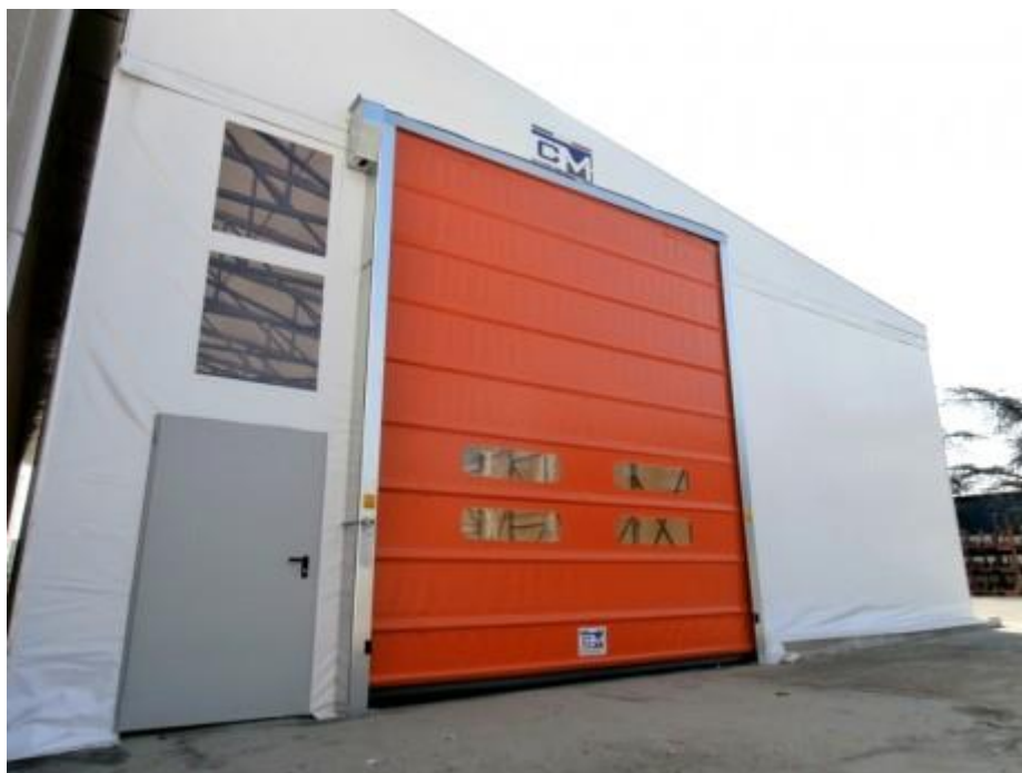
Copriscopri mobile + porta rapida automatica (MODENA)