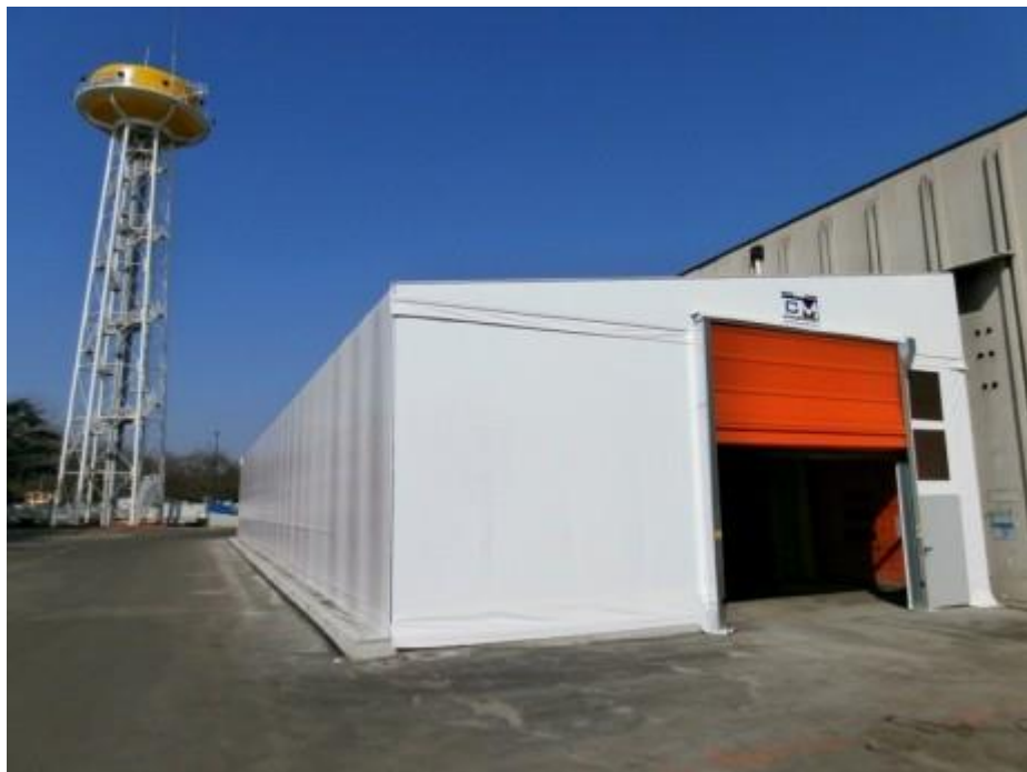
Tunnel mobile + porta rapida (MODENA)