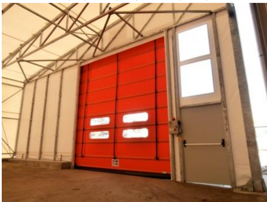
Capannone mobile + porta rapida automatica (MODENA)