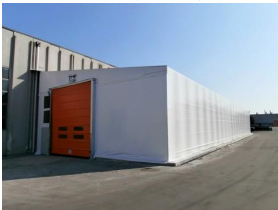
Copriscopri mobile + porta rapida (MODENA)