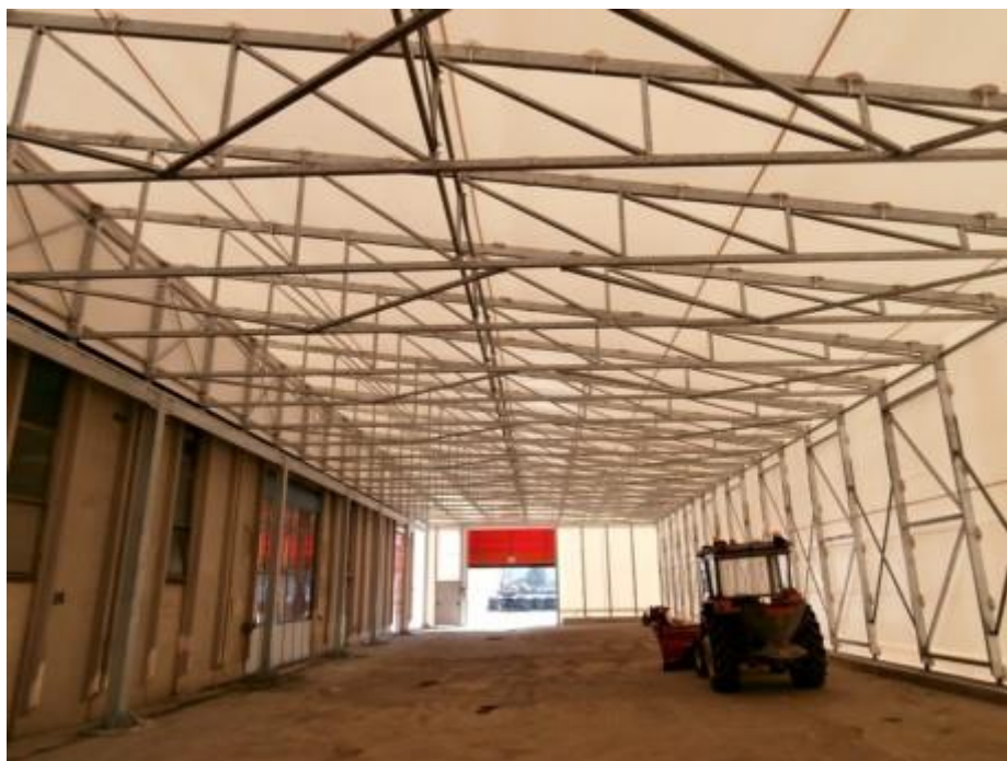
Capannone mobile su binari (MODENA)