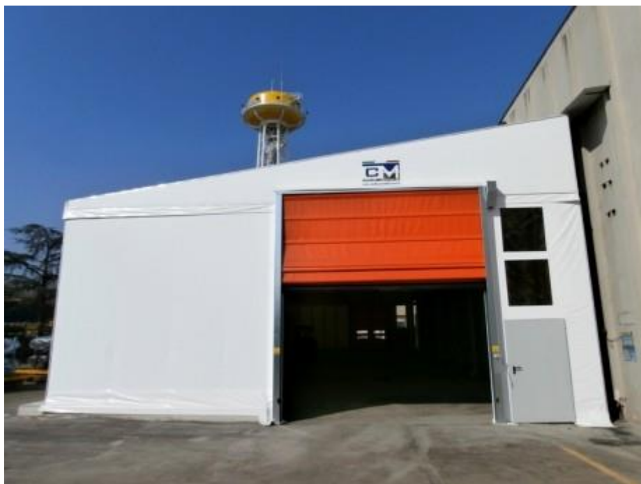
Copriscopri mobile + porta rapida (MODENA)